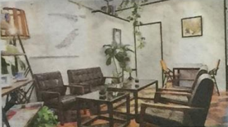
◎店內風格帶有復古與現代交雜的氛圍，讓人一眼難忘。 ◎中淺焙台灣(熱)/210元 使用伊藤篤臣挑選、來自嘉義阿里山的咖啡豆，酸味凸顯但入喉順口，帶有杏仁與山莓香味。

《16個夏天》阿慶工作的花店是《16個夏天》的重要場景，從第六集開始出現的阿慶(丁國慶)所工作的花店，就是在此取景，劇中的五人幫曾於店中分享與經歷不少喜怒哀樂。這間店實際上是知名主持人吳建恆開設的咖啡館，劇中最常出現的便是進門右側的沙發區與吧台。店家還發揮巧思，把每次片頭出現於信紙上的唐家妮畫像，做成卡布奇諾上的拉花，由於微妙維肖，獲得不少客人上門指定要喝這杯「唐家妮咖啡」。