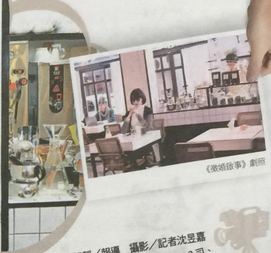
記者魏好靜/報導