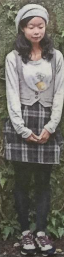
胡如虹和她的藝人朋友們 E2 許瑋甯 赤裸釋放戲魂