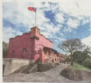
◎被稱為「紅毛城」的淡水紅毛城，已有近四百年的歷史，見證北台灣作為西班牙殖民的歷史過往。