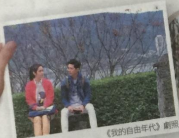
《我的自由年代》劇照