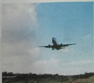
飛機巷 ◎台北市中山區濱江街180巷

《我的自由年代》阿慶與Tracy看飛機約會地 阿慶與Tracy在《我的自由年代》中是很愛鬥嘴的一對，兩人曾在第十三集時到一處可近距離看飛機的地方約會，此處即是松山機場旁著名的「飛機巷」，因為距離機場西側跑道非常近，因此不少愛好攝影的人會特地來此拍攝飛機起降的畫面。