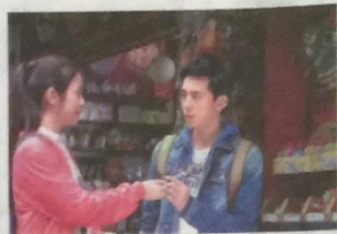
◎淡水老街上，劇中流川與林嘉恩互贈童玩小禮物的場景，其實是一間復古童玩店。

☎ (02) 2629-7321 ☒ 新北市淡水區中正路144號 09:00~22:00，無休